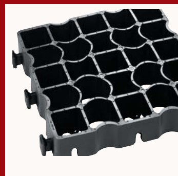
EcoRaster® E50 oder EH40